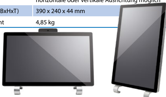
Horizontale oder vertikale Montage bzw. Aufstellung (Zubehör optional).