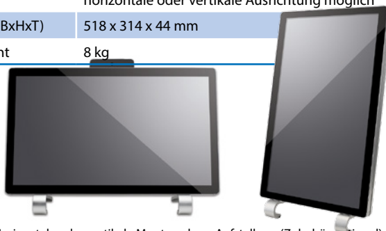
Horizontale oder vertikale Montage bzw. Aufstellung (Zubehör optional).