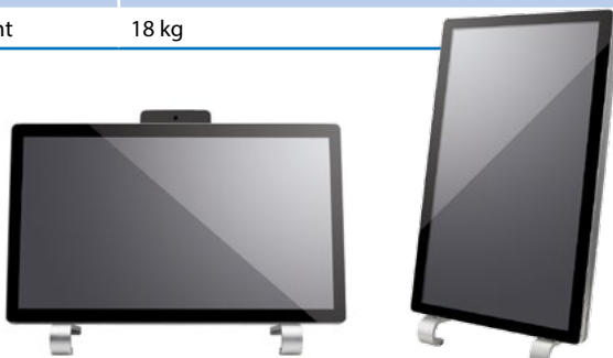
Horizontale oder vertikale Montage bzw. Aufstellung (Zubehör optional).